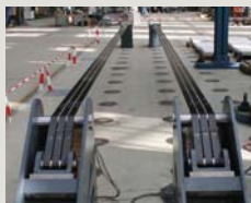
Foto rechts: Blick in den Verankerungskörper Photo on the right: View in the anchorage body

Zeichnung: CFK-Band Illustration: Non-laminated CFRP ribbon