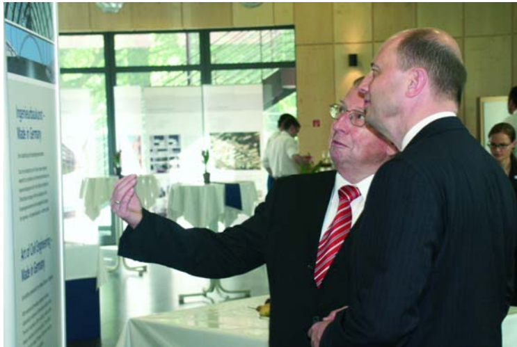
Dr.-Ing. Schwinn (Ausstellungsmacher) in der Diskussion mit Bundesminister Tiefensee (Förderer der Ausstellung)

Regionalsponsoren: erhalten die Möglichkeit, sich auf den Informationsmaterialien und Druckerzeugnissen der jeweiligen Wanderausstellung zu präsentieren. Die entsprechenden Sponsorenvereinbarungen werden zwischen Regionalsponsor und dem regionalen Veranstalter getroffen. Die Bundesingenieurkammer erhält 10 Prozent des Regionalsponsorings für Weiterentwicklung und Erhalt der Ausstellung.